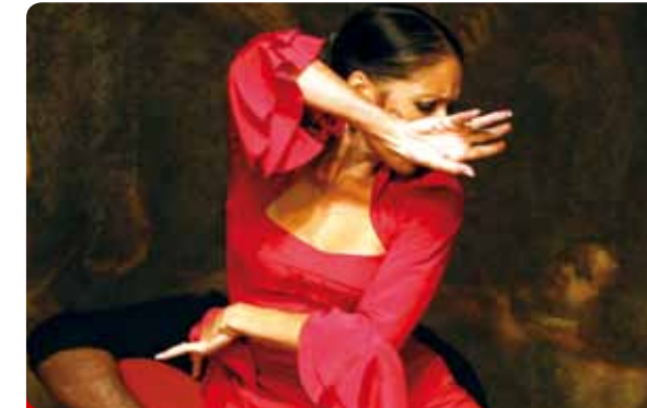
Corral de la Morería