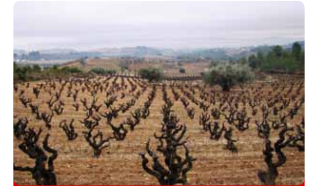
Curso de Cata y Visita a Bodega

¿Sabías que la presencia del caballo en nuestro país es tan remota que ni historiadores ni paleontólogos han podido establecer exactamente sus inicios, o que el origen de la influencia del caballo y, en concreto, del caballo andaluz, dentro de nuestra cultura coincide con el florecimiento de las primeras grandes civilizaciones en la Península? Pues esto y muchas otras cosas es lo que vas a aprender durante esta interesante visita a la Yeguada La Cartuja donde podrás asistir, además, a una exhibición de bellísimos ejemplares. ¡Te encantará!