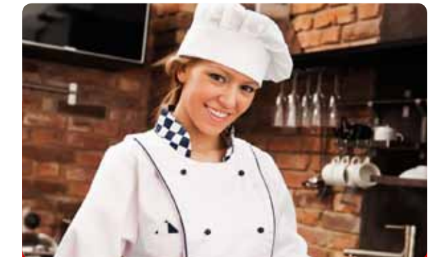
Taller de Iniciación a la Cocina

Cuídate como te mereces en el Gran Hotel Balneario Blancafort, un oasis de bienestar entre jardines y cascadas que cuenta con un lujoso centro termal. Tres mil metros cuadrados de sofisticación divididos en dos zonas y dos circuitos termales para que elijas cómo prefieres relajarte. En el Templarium encontrarás una réplica exacta de unas termas romanas, con Tepidarium, Frigidarium y Caldarium para liberar toxinas, mientras que en el Natatorium podrás disfrutar de una piscina de tratamientos de hidroterapia termal en aguas minero-medicinales.