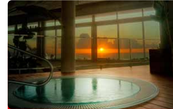
Peeling Corporal con Baño de Burbujas