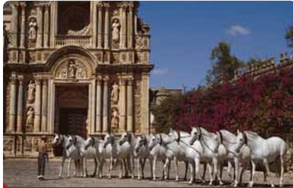
Exhibición de Caballos