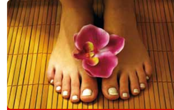
Tratamiento Mágico de Pies