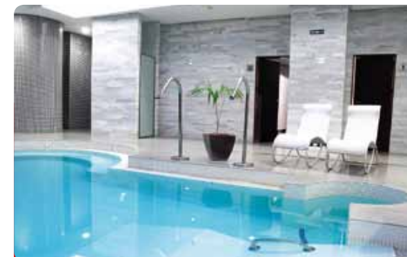
Un día en el Yacht Club Cala d'Or