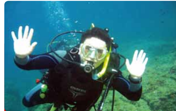
Iniciación al Buceo Nocturno