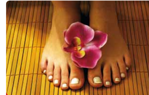
Tratamiento Mágico de Pies