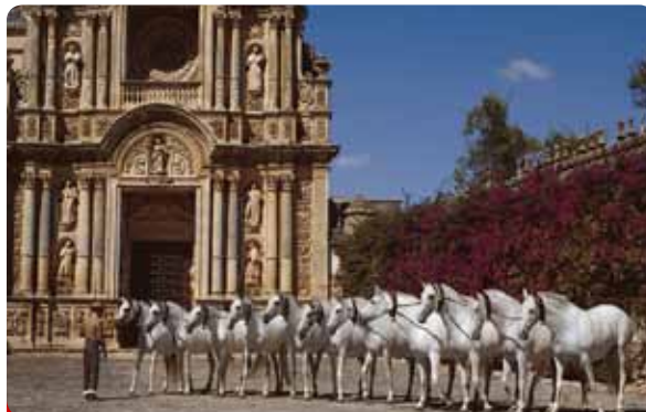
Exhibición de Caballos