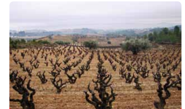
Curso de Cata y Visita a Bodega

¿Sabías que la presencia del caballo en nuestro país es tan remota que ni historiadores ni paleontólogos han podido establecer exactamente sus inicios, o que el origen de la influencia del caballo y, en concreto, del caballo andaluz, dentro de nuestra cultura coincide con el florecimiento de las primeras grandes civilizaciones en la Península? Pues esto y muchas otras cosas es lo que vas a aprender durante esta interesante visita a la Yeguada La Cartuja donde podrás asistir, además, a una exhibición de bellísimos ejemplares. ¡Te encantará!