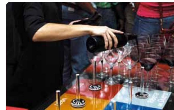
Cata de Vino